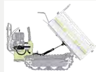
Kit für hydraulisches Kippen