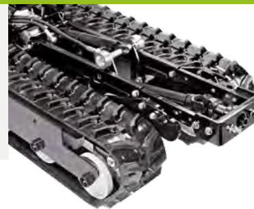
Kit für hydraulisches Heben mit frontaler mechanischer Zapfwelle mit 965 U.p.M.

Das schwenkbare Schneeschild mit 125 cm erweist sich als nützlich zum schnellen Anhäufen an den Seiten und das Räumen gepflasterter Flächen. Es ist mit regulierbaren Stützscheiben ausgestattet; (optional) gibt es eine Gummileiste, zum Schutz der Pflasterdecke und um den Verschleiß der Unterkante zu vermeiden.