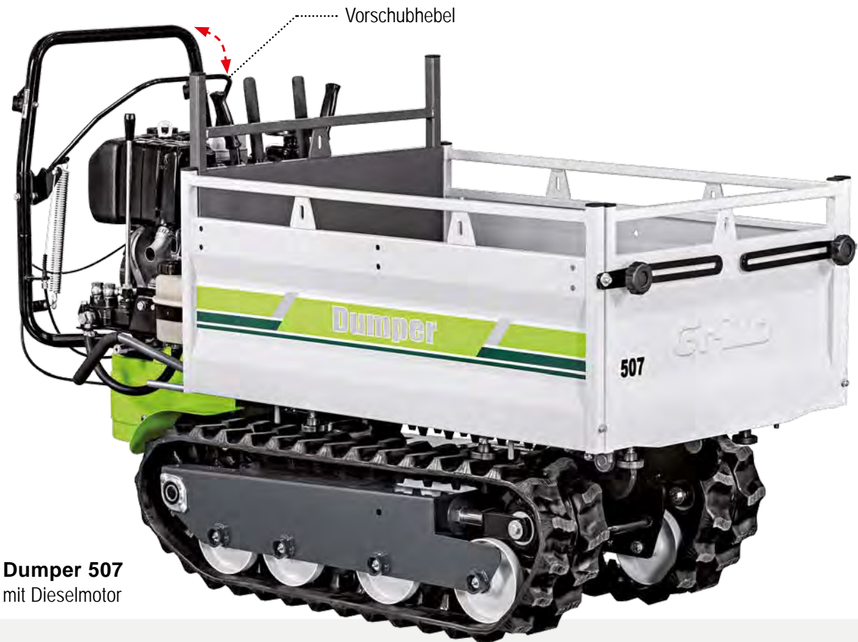
Dumper 507 mit Dieselmotor

Der Dumper 507 ist ein leistungsfähiger und vielseitiger Raupentransporter, welcher zum Transport jeglicher Art Material in unterschiedlichen Bereichen geeignet ist. Der völlig mechanische Antrieb erlaubt die totale Ausnutzung der Motorleistung. Das Schaltgetriebe hat 4 Vorwärtsgänge , mit einer Höchstgeschwindigkeit bis zu 8.7 km/h, und 3 Rückwärtsgänge . Die Hebelsteuerungen des D 507 sind bequem erreichbar. Die Raupenketten aus Gummi haben Kettenglieder aus Stahl. Die Maschine kann ausgerüstet werden mit einem leistungsfähigem Benzinmotor mit 270-301 cc Hubraum und mit Dieselmotor mit 349 cc Hubraum , mit Reversierstarter oder E-Start. Dies garantiert alles eine Tragfähigkeit von gut 500 kg und ermöglicht die Benutzung in unterschiedlichen Einsatzbereichen und für zahlreiche Anwendungen. Beide Motoren letzter Generation, mit geringen Abgasemissionen und niedrigem Verbrauch, haben ein großes Vorteil des Drehmomentes bei niedrigen Motordrehzahlen.