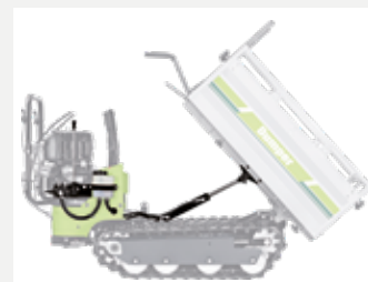
Kit alzamiento hidráulico.