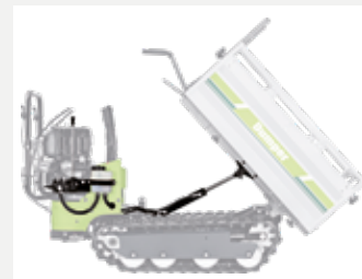
Kit basculement hydraulique.