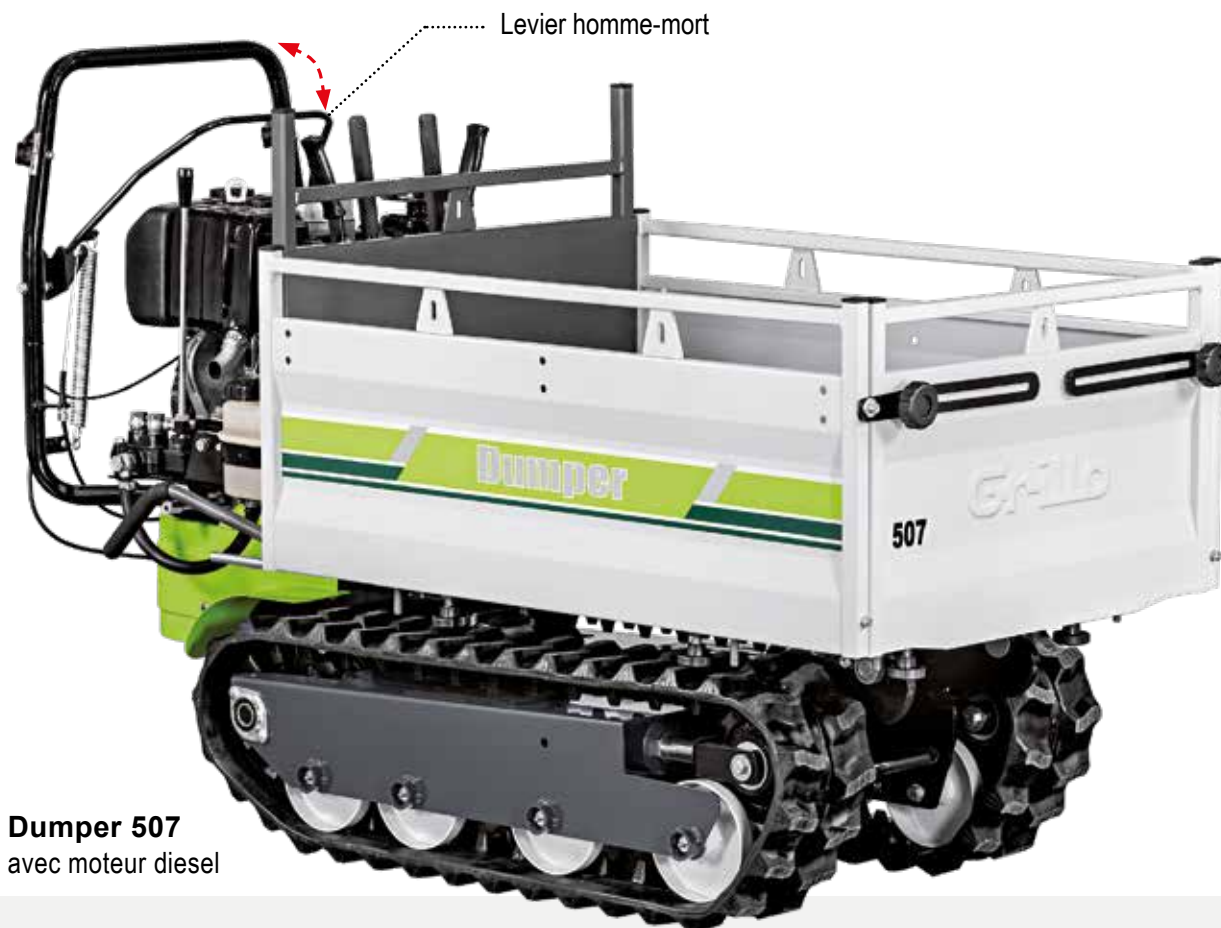
Dumper 507 avec moteur diesel

Les commandes sont toutes ergonomiques et intuitives. Les chenilles sont en caoutchouc avec renforce interne en acier. Cette machine peut recevoir des puissants moteurs essence de 270-301 cc et diesel de 349 cc , avec démarrage par lanceur ou électrique pour offrir une charge utile de 500 kg ainsi que l'utilisation de plusieurs accessoires. Les deux versions de moteurs ont comme caractéristique principale celle d'avoir une couple à bas régime. Les moteurs des Dumper 507 sont de dernière génération, modernes avec bas émissions et consommations réduites.